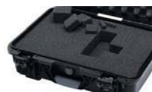
Calages de mousse cubique