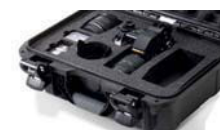
Mousse coupée sur mesure