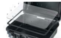
Ensemble de panneau étanche